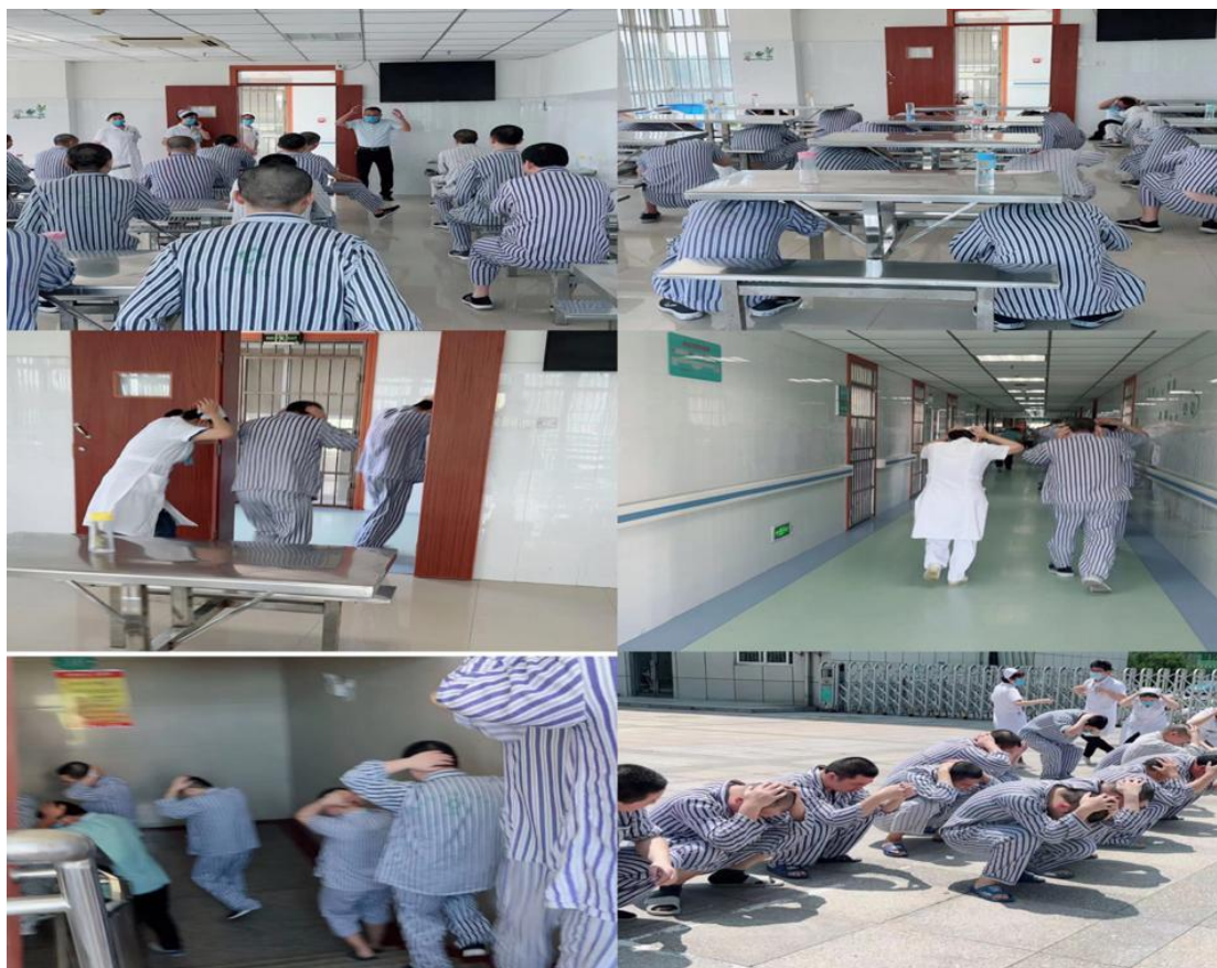
整个演练过程紧张有序，有条不紊