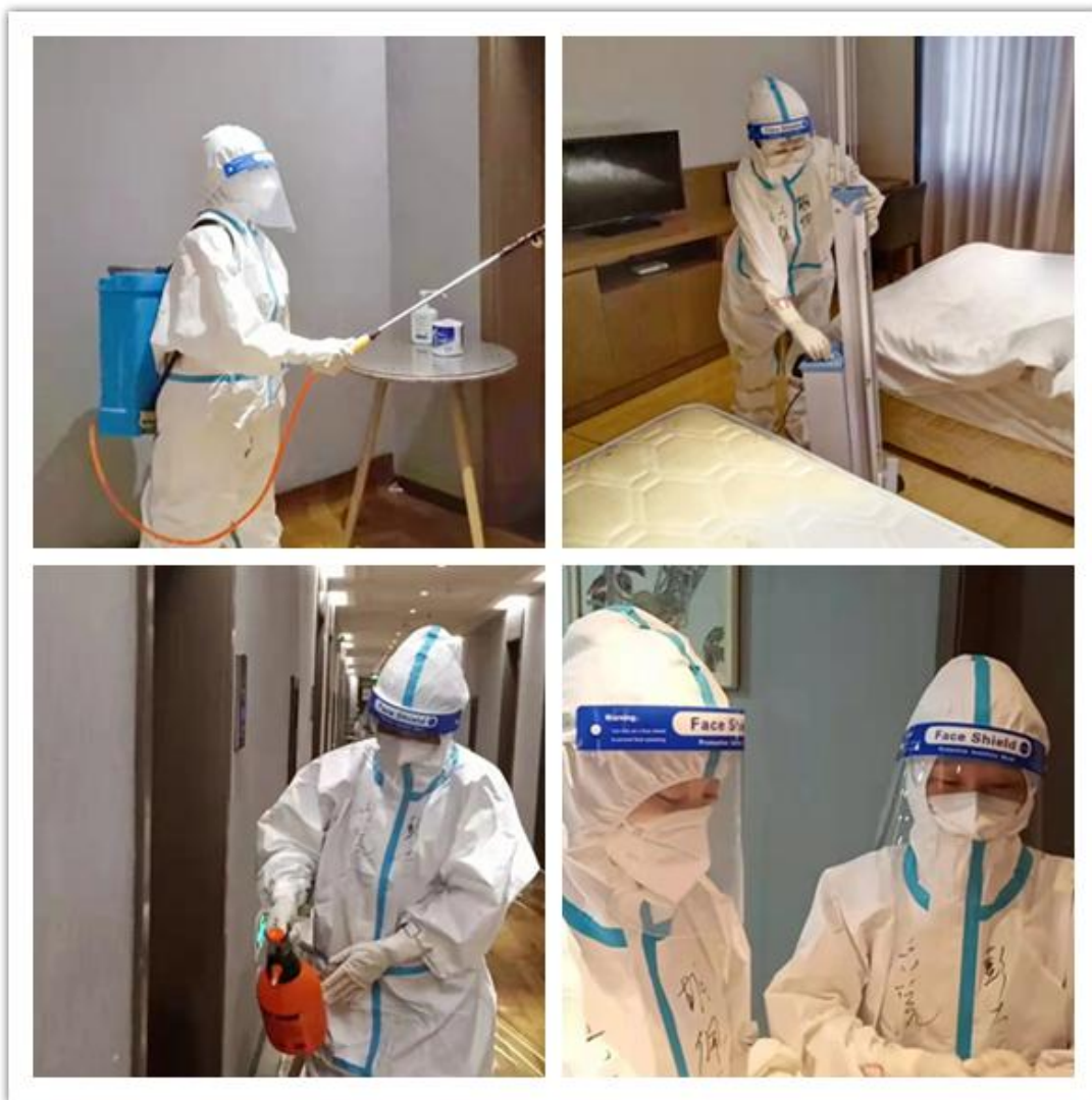
隔离点每日的消杀工作

每天的工作总是这样重复、紧张、忙碌着。转眼间，“五一”劳动节到了。当大都数人在家尽情休假放松的时候，我们还坚守在“战场”持续战斗着。